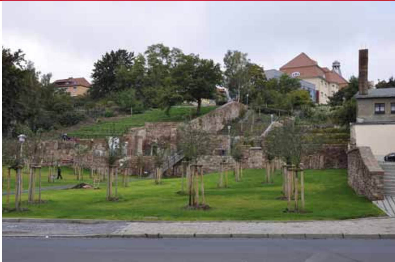
Ungdomar har byggt parken på murrester av rivna hus i Eisleben, en av städerna i IBA Sachsen-Anhalt.