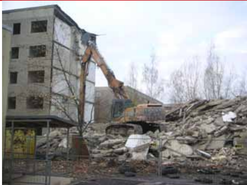
Rivning har varit en del av omvandlingen i Halle-Neustadt.

► Halle-Neustadt bland annat fått en spår-vagnslinje som länkar samman den gamla och den nya delen av staden. Under första halvan av 2000-talet öppnade också ett temporärt hotell i ett tomt höghus i Neustadt. De 92 rummen var inredda av ungdomar i staden och hade alla olika teman, till exempel farmorsrummet och Britneyrummet. Hotellet, som drevs av en teatergrupp, fungerade också som ett kulturhus med shower och installationer.