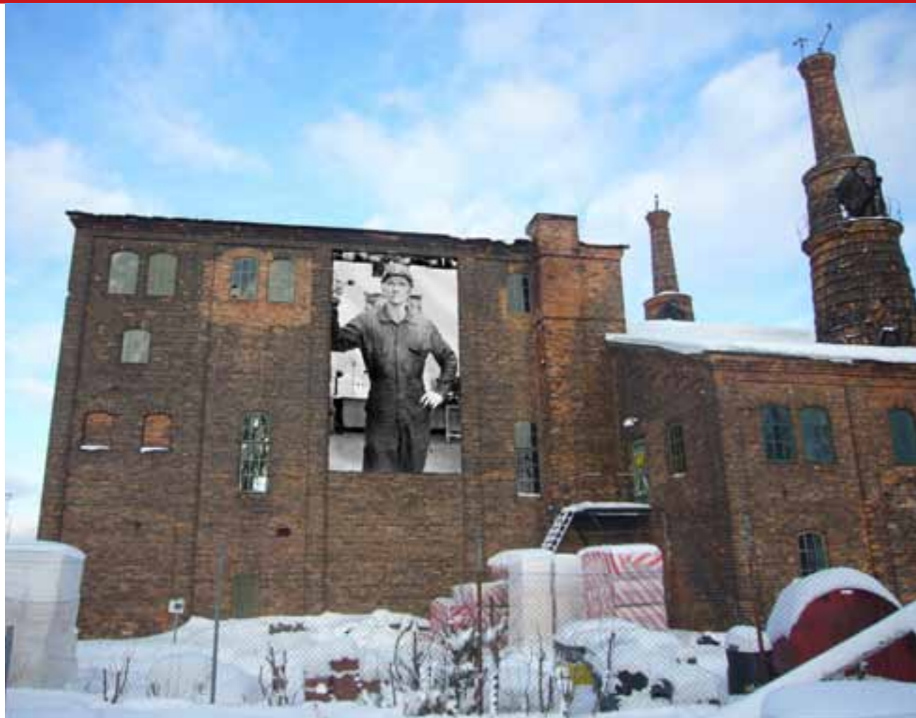
Inspiration hämtas i Ruhrområdet och tas med till Forsbacka bruk.